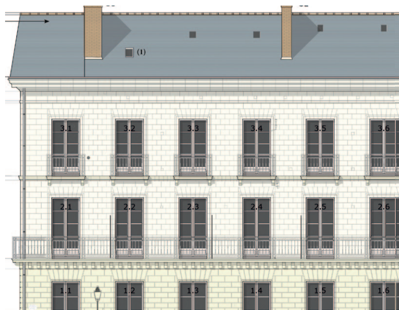
Exemple de plans associés à une déclaration préalable de travaux : état existant - Immeuble 2, place Ste Croix, Nantes,