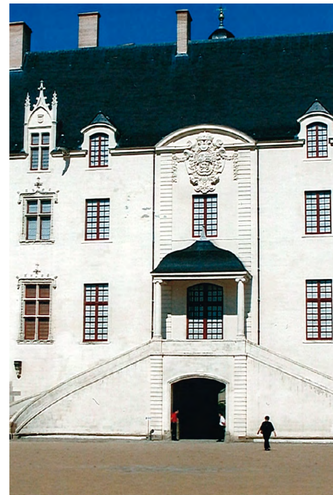
Restauration du château des ducs de Bretagne

Remplacer une fenêtre peut devenir indispensable par son état, pour des raisons d'économie d'énergie ou d'esthétique. Il sera cependant toujours préférable d'envisager sa restauration, en particulier si elle est caractéristique de l'époque de construction de l'immeuble et n'est pas de dimensions standard. Une fenêtre moderne n'est pas obligatoirement plus durable.