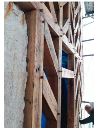
Restauration au 10, rue neuve des Capucins, Alain Bacon architecte DPLG (agence TILT)