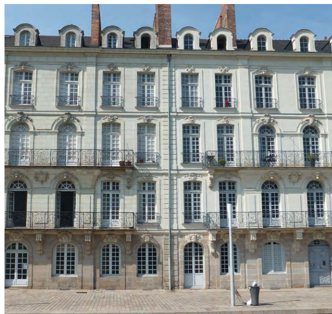
Façades du 9 et 9 bis, allée Turenne, © Patrick Leray