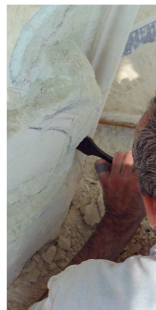
Taille de pierres