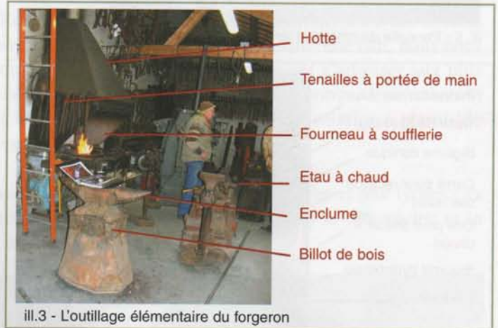
ill.3 - L'outillage élémentaire du forgeron