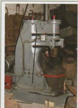
ill.2 - Marteau pilon

Même si de nouvelles techniques sont apparues avec la mécanisation, tel que le marteau pilon [ill.2] (utilisé par exemple pour l'estampage de main courante), l'outillage élémentaire d'un ferronnier reste le fourneau à soufflerie, l'enclume, les marteaux et les pinces [ill.3].