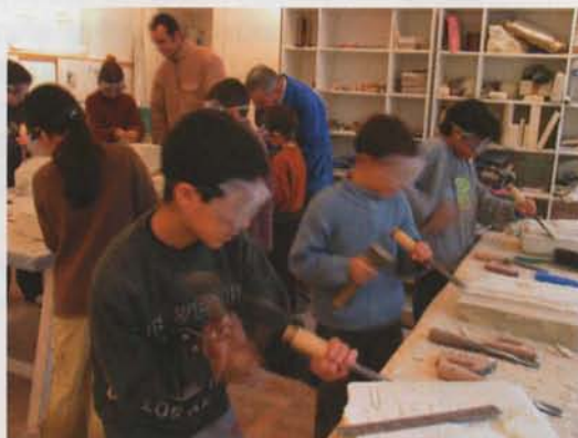
Rencontre avec des professionnels

Deux grands thèmes sont proposés aux écoles primaires, aux collèges et aux lycées : la sensibilisation aux métiers et aux matériaux de la restauration dans le bâti ancien et la sensibilisation au patrimoine et à l'architecture.