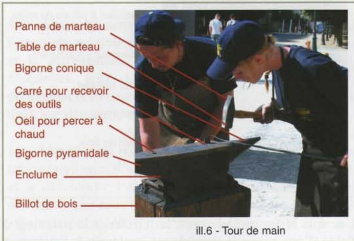
ill.6 - Tour de main