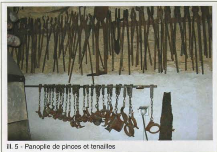
ill. 5 - Panoplie de pinces et tenailles