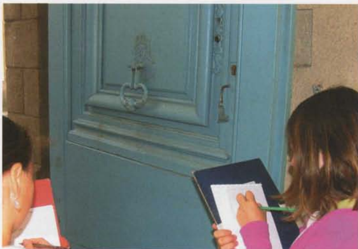
Education au regard

Une démarche active : cette rencontre est favorisée par l'approche sensible des ateliers basée sur l'expérimentation et la participation. Les outils pédagogiques adaptés – maquettes, jeux de construction, livrets de visite – permettent la manipulation et l'observation, plaçant l'élève dans une démarche active et parfois créative.